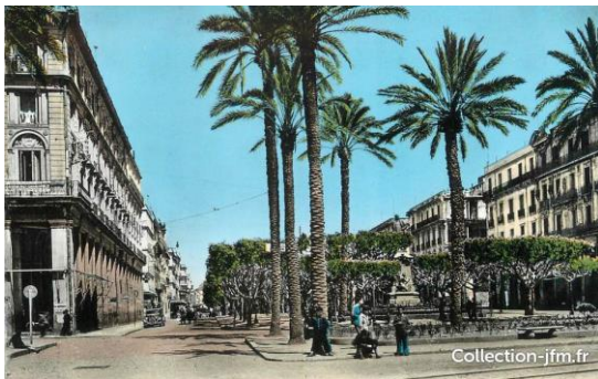
Ville coloniale Annaba