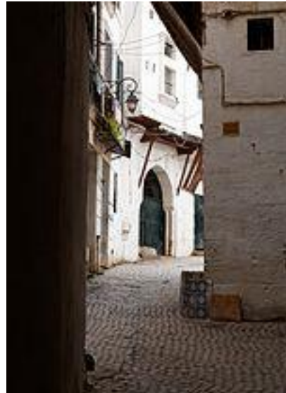
La Casbah d'Alger