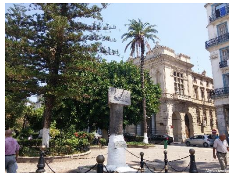
Ville coloniale Annaba