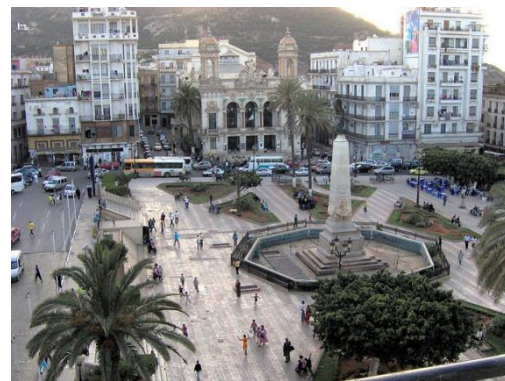
La Place d'armes - Oran