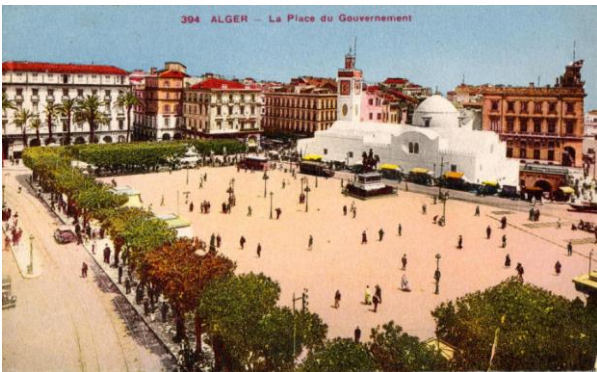
Place des Martyres – Alger