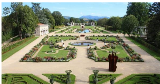
Villa Arnaga - Musée d'Edmond Rostand à Cambo-les-Bains - France