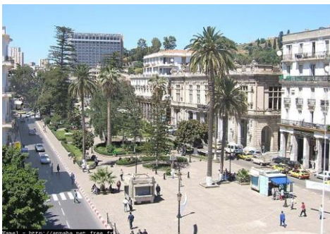
Le cours d'Annaba