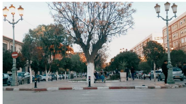
Les allées de Ben Boulaid - Batna