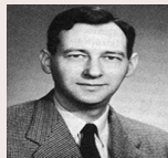
Figure – T.C. Koopmans (1910-1985)