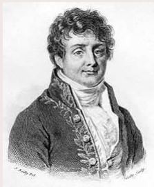
Figure – J. Fourier (1768-1830)