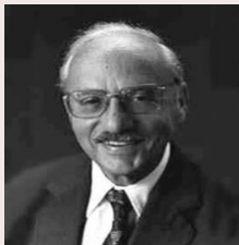
Figure – G. Dantzig (1914-2005)