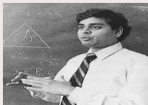
Figure – Narendra Karmarkar (1957)