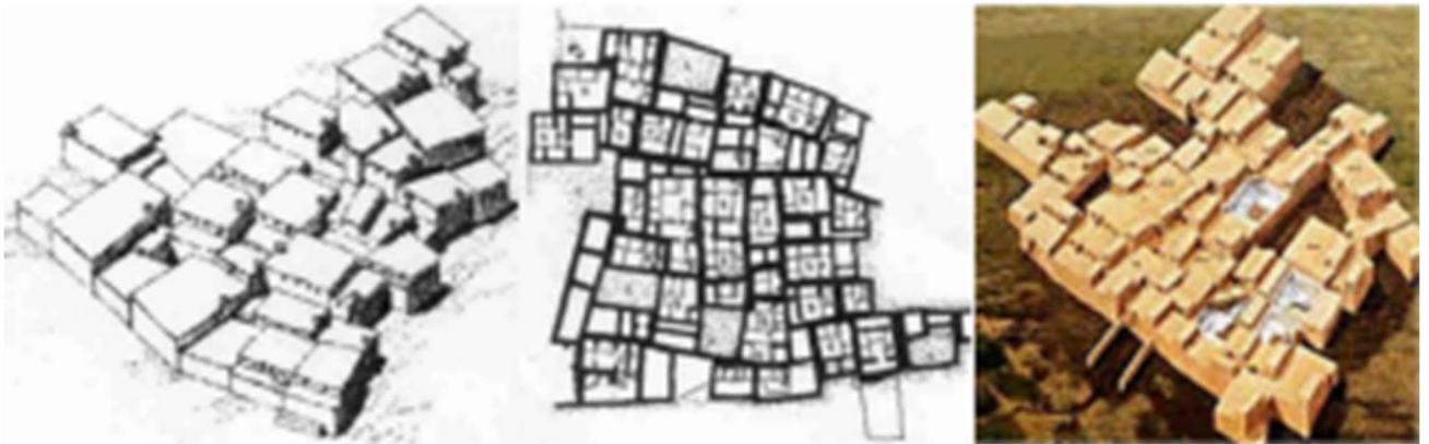
Pla de masse et volumétrie du village Çatal Huyuk ;

Le village néolithique, est un village qui abrite selon les archéologues entre 5000 et 10000 habitants sédentaires qui pratiquaient l'agriculture et l'élevage. Les bâtisses sont construites selon un style architectural magnifique avec des murs en briques crues et de la boues séchées, leurs auteurs sont appropriées, dont la plupart sont décorées d'étonnantes sculptures et peintures. Toutes les constructions sont juxtaposées les unes aux autres, l'absence des rues est très marquant peut être pour des raisons de défense. L'accessibilité se fait à travers les toitures par des ouvertures qui sert également de ventilation ou nous accédons à la pièce ou qui sert comme cuisine puisque nous trouvons le four. Les morts sont enterrés sous la plateforme des constructions. Tous ces bâtisses ne servent pas uniquement à l'habitat, beaucoup d'entre elles sont des « sanctuaires ». Seulement rien du style architectural ne permet de faire la distinction ; la différence se situe ailleurs, dans la décoration des murs et dans l'équipement du sol.