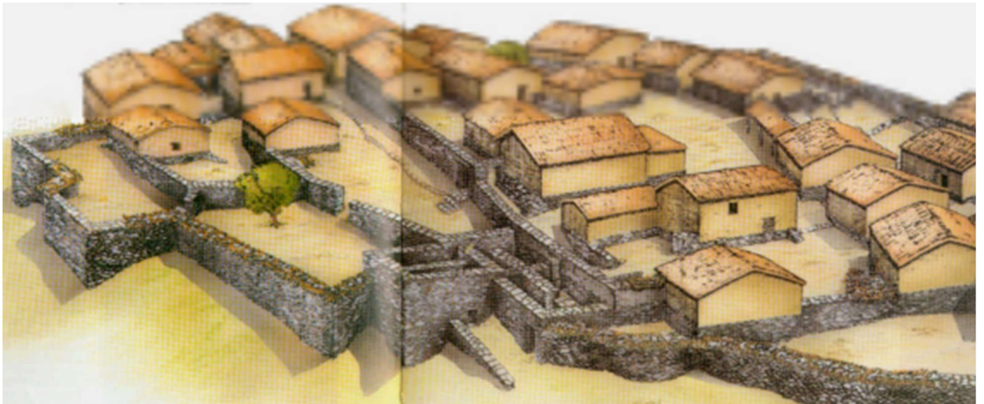
Acropole de Sesklo (Vème millénaire) : néolithique moyen L'utilisation généralisée de la pierre dans la construction des murs et des fondations. Le tableau nous donne une idée de l'assemblage des bâtiments du village.