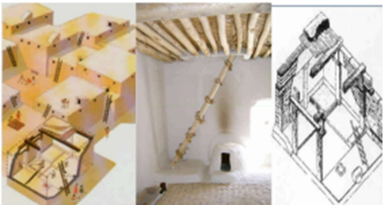
Plan d'accessibilité et de l'intérieur des habitations du village