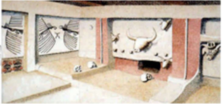
Plan d'intérieur et de décoration des temples

Türkiye : Le Néolithique au Proche-Orient. Fondée vers 7000 avant JC, elle devint un centre important entre 6500 et 5700 avant JC.