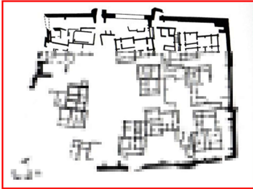
Mésopotamie néolithique : plan de Flint Hill, Irak, culture de Samarra (6200-5700 avant J-C. )