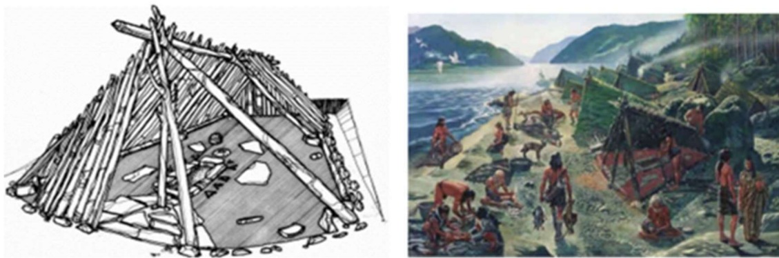
Reconstruction de la structure d'un Hutte en Serbie (8000 avant J-C)

De 10 000 à 7 000 ans après la période glaciaire et les changements climatiques, qui ont entraîné la disparition d'un grand nombre d'espèces de la faune et la flore, accompagnés d'importantes découvertes de l'homme à des matériaux, avec lesquels il a pu fabriquer des outils simples pour la chasse et ses pratiques quotidienne de pierres, d'os et de branches d'arbres, ainsi que de peaux d'animaux.