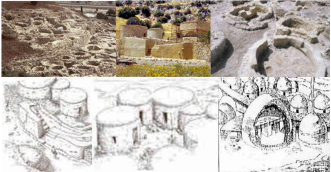
Khirokitia sur l'île de Chypre 7ème siècle avant J.C