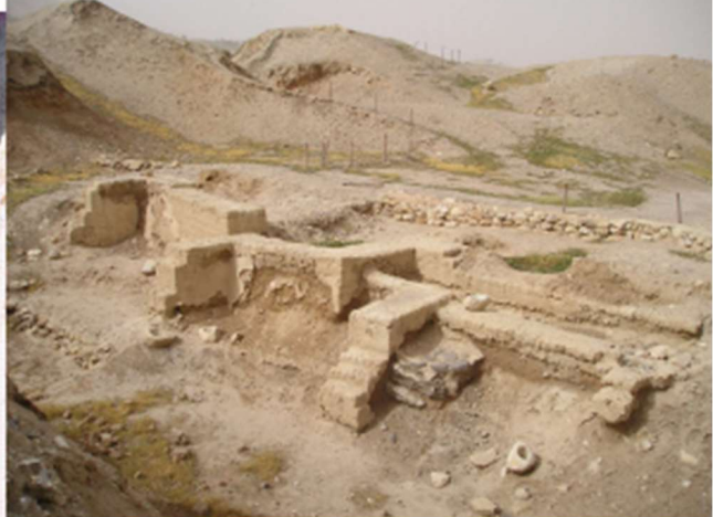
Tell es-Sultan en PALESTINE entre 10 000 et 9 000 av. J.C ; Néolithique précéramique .