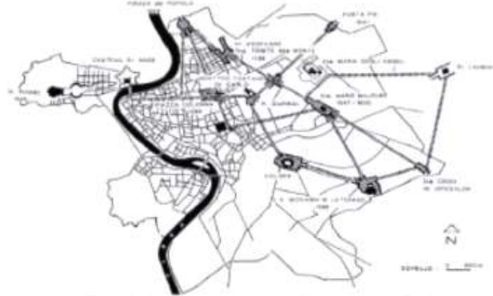
التعقيد الباروكي للرسومات يساهم في خلق عقد رمزية (L'etoile de Sixte)