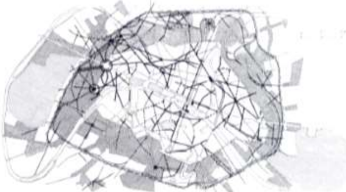
التعقيد في رسوم الطرقات على الرغم من التدخلات الهوسماتية على باريس (موضحة بالخطوط السوداء)