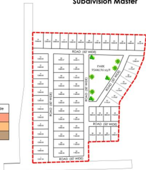
BLACK & WHITE PLAN