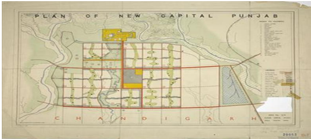
الشكل 1: المخطط التوجيهي لشانديغار

-المخطط الرئيسي لمدينة شانديغار: في شانديغار، كان لو كوربوزييه مسؤولاً عن المخطط الرئيسي للمدينة، حيث ترأس فريق المهندسين المعماريين من خلال إنشاء المباني الحكومية الثلاثة الرئيسية: مبنى المحكمة (1955)، والسكرتارية (1958)، وهو المبنى الرئيسي لمدينة شانديغار. مقر الوزارات والبرلمان (1962).