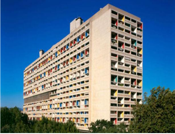
الصورة 4: مدينة الحدائق بيساك.