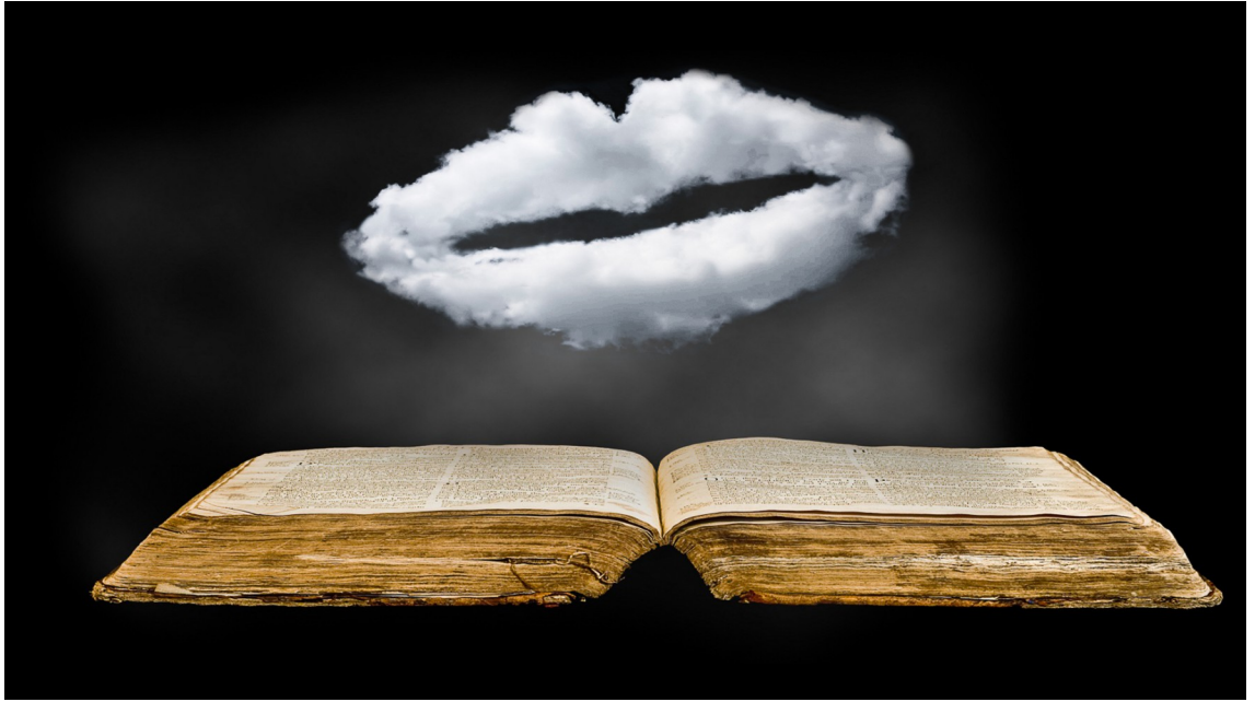
الانتقال من الشفهي إلى الكتابي

عرف الكلام قبل الكتابة ولما ظهرت هذه الأخيرة كانت مكتملة له؛ فالكتابة هي فكر ولغة جسدت على مساحات، كما أنها لا تستخدم إلا بوصفها مكتملا للكلام، ويتم تحليل الفكر عن طريق الكلام، كما يتم تحليل الكلام عن طريق الكتابة، ويمثل الكلام الفكر من خلال علامات اصطلاحية وتمثل الكتابة الكلام بالطريقة نفسها.