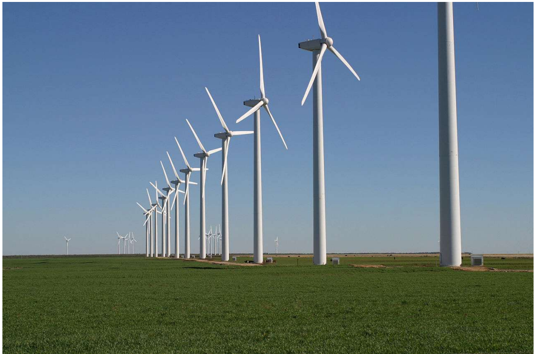
Énergie du vent