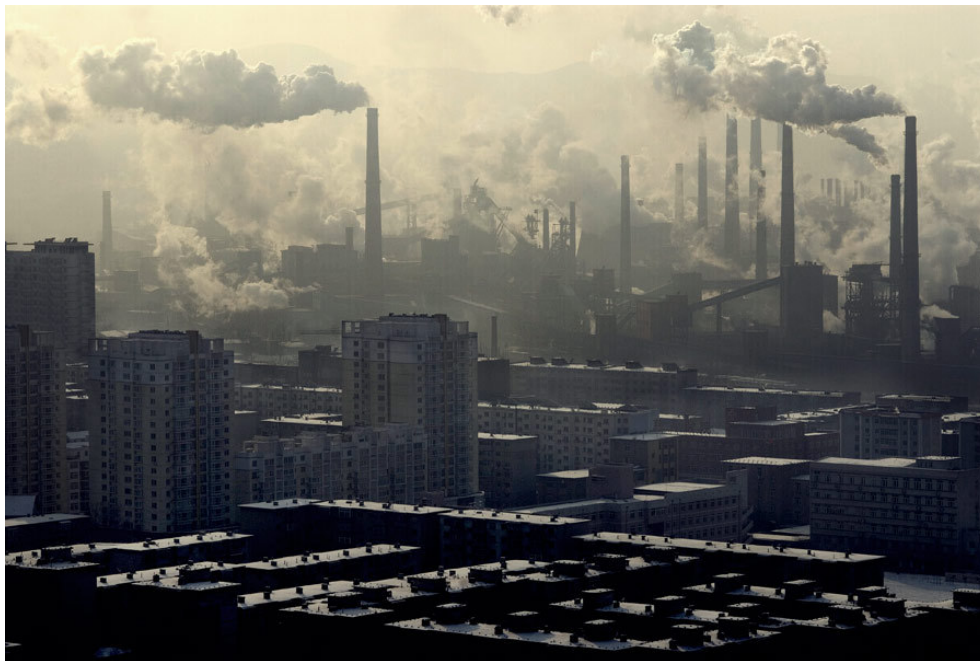
Pollution à cause de l'utilisation de l'énergie fossile

la combustion des produits fossiles dégage d'importante quantité de CO 2 dans l'atmosphère, responsable du réchauffement climatique. Les marées noires provoquent d'importants dégâts sur les côtes. L'extraction du charbon a provoqué de nombreux morts par accidents ou maladies.