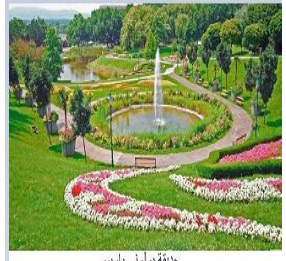
حديقة بولوني باريس