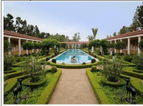
الحدائق الرومانية

تميزت بكثرة المنشآت المعمارية والتماثيل والنافورات على حساب النباتات. كما انتشرت أماكن الجلوس وزرعت الأشجار في أصص كبيرة من الخزف المزخرف خاصة أشجار السرو والصنوبر والزيتون وبذات تظهر لأول مرة حدائق الميادين والحدائق العامة لأفراد الشعب بعد أن كانت الحدائق قاصرة على قصور الملوك والأغنياء.