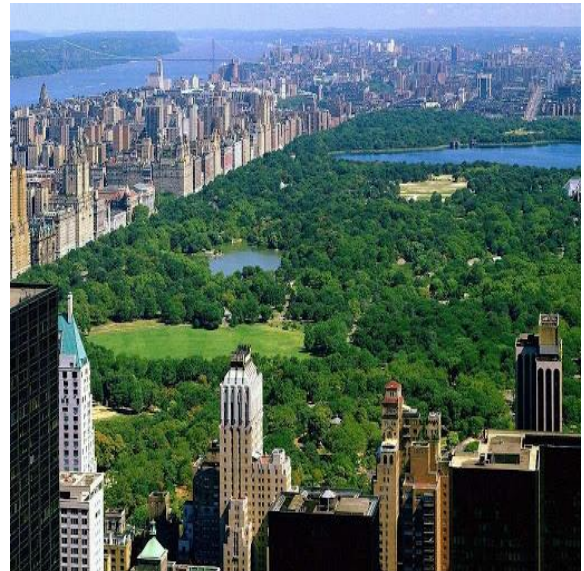
سنترال بارك Central Park. مدينة نيويورك