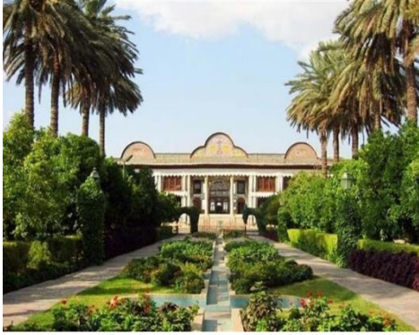
الحديقة التراثية دلگنا في مدينة شیراز .