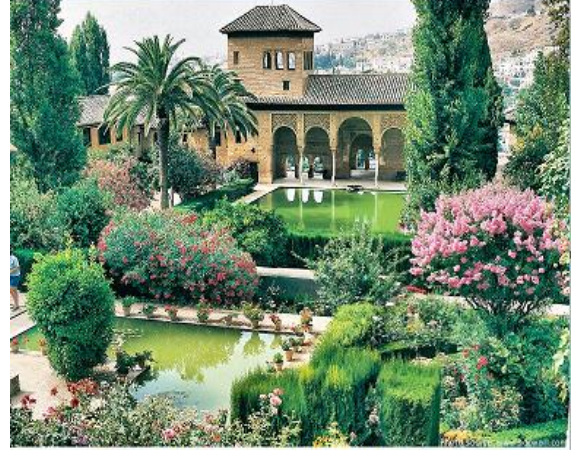
حديقة قصر الحمراء فى قرطبة