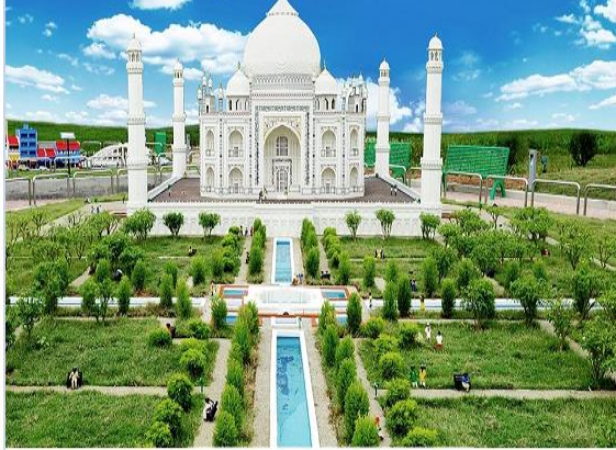
حديقة تاج محل بالهند