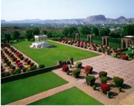
حديقة خلتية في قصر أوميد بيوان في مدينة جودبور في الهند

ولقد اهتم الطراز الهندي المغولي بالمعمار على حساب النباتات التي اقتصر استخدامها على بعض المخروطيات لانتظام شكلها وبعض العشبيات المزهرة، ومن اشهر الحدائق الهندية حديقة تاج محل.