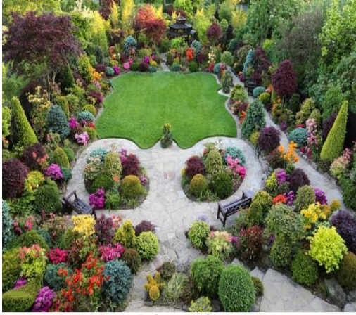
حديقة الفصول الأربعة من أجمل حدائق في العالم