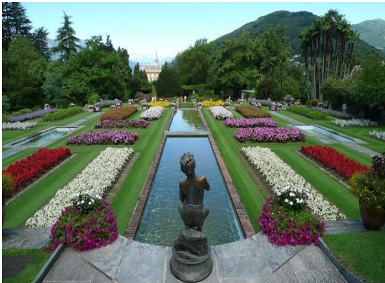
جياردينى بوتانىشى فيلا تارانتر ، بيدمونت ، إيطاليا

-وللاستفادة من المناظر الطبيعية حول الحديقة سمح بوجود فجوات فيما بين الاشجار حتى يستطيع النظر ان يتعدها الى ما حولها كما ادخلت فى الحدائق لأول مرة الحيوانات المفترسة واقفاص الطيور النادرة ومنها ظهرت حدائق الحيوان المنتشرة الان فى جميع انحاء العالم.