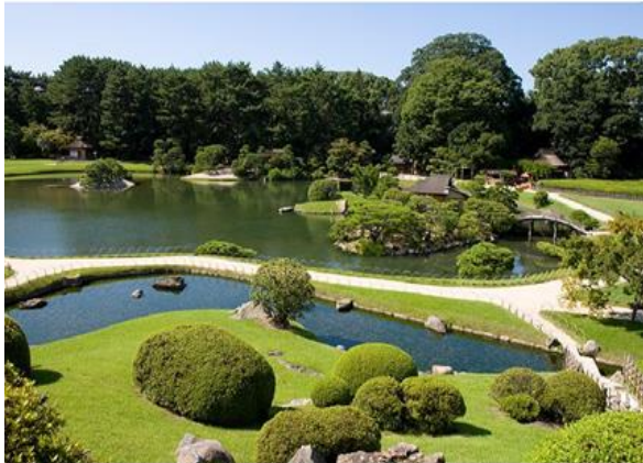
الحدائق اليابانية...أروع وأجمل حدائق العالم

هذا النوع من الحدائق يعتمد على اقامة بحيرات طبيعية تعلوها جسور خشبية او من الحجارة وحول البحيرة تلال تزرع بالأشجار والشجيرات وبها اماكن للجلوس. الطرق فى الحديقة منحنيه بشكل طبيعي ومرصوفة بالحجارة المسطحة وكثرت زراعة الاشجار والشجيرات المستديمة الخضرة المزهرة بشكل متتابع لتعطى ازهار شبه دائم على مدار السنه وتميزت الحدائق النباتية بعدم وجود مسطحات خضراء والتي استبدلت بالرمل او الحجارة. اذن الطراز الياباني طراز طبيعي استمد اسسه من واقع الطبيعة المحيطة