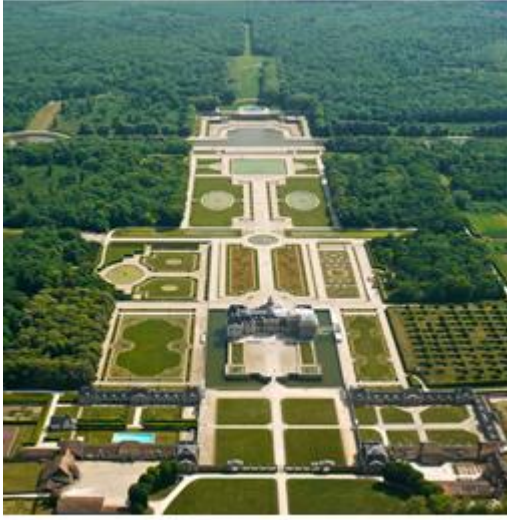
Vaux-le-Vicomte حدائق قصر فو فيكومت بفرنسا.

زراعة اشجار متدرجة الاطوال على جوانب الطرق والمشايات بحيث توضع اطوالها في البداية واقصرها في ابعد نقطة وكذلك من خلال اختلاف مسافات الزراعة فيما بينها فهي تضيق تدريجيا مع زيادة البعد.