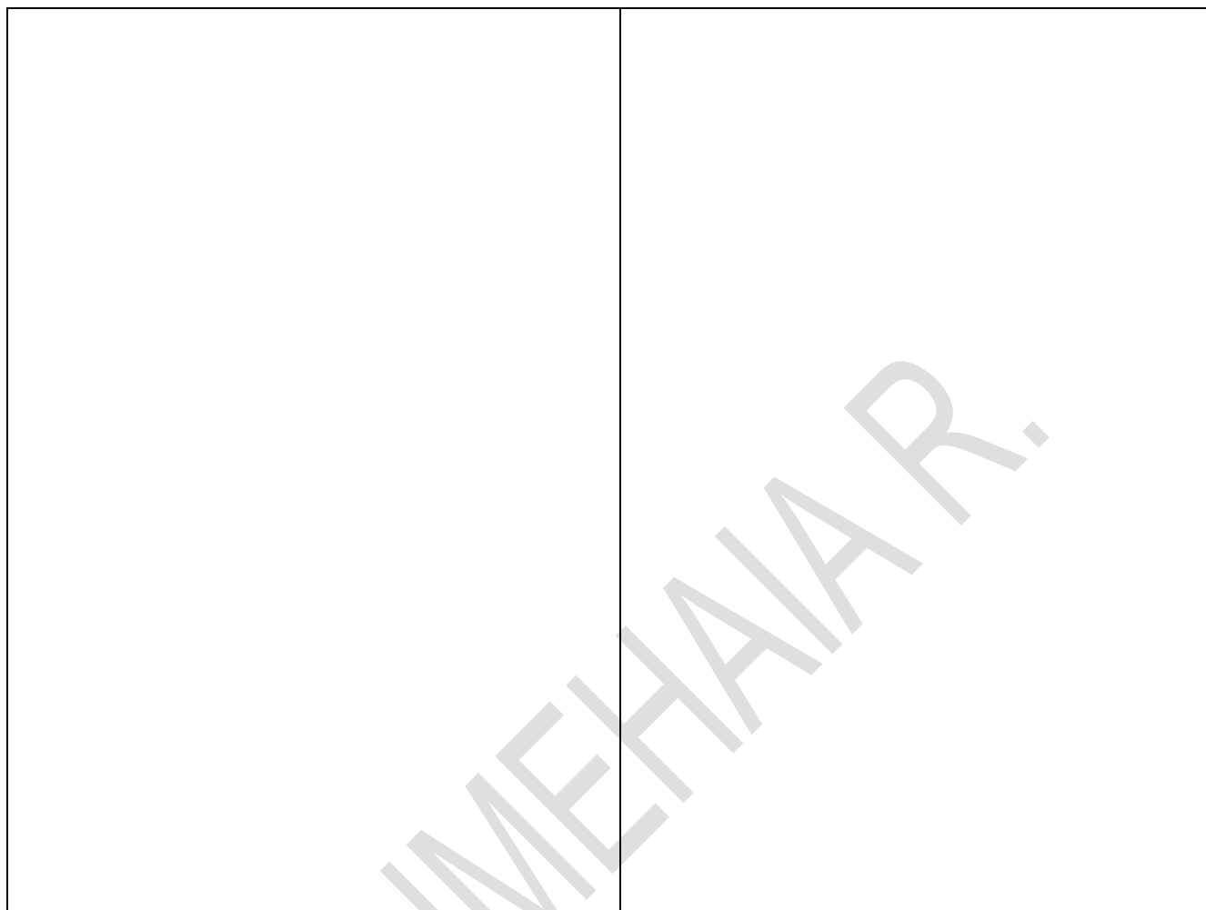
Tableau 3 - Exemple de tableau

Tableau 2 - Production et types de vins des vignobles commerciaux du Québec, par région, en 1997