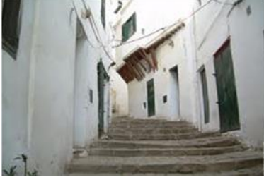
تدرج المجالات: شارع - زقاق - درب - دار