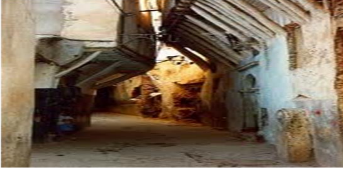
وفرة الظلال لتدروب

و قد حرص المصممون على ضمان تدرج تام أو شبه تام للمجالات العمرانية في المدينة الإسلامية حفاظا على حرمة المجالات الداخلية في حدود القدرة الممكنة، ويعطي هذا التنظيم المجالي المحكم نسيجا عمرانيا متضامنا و متراص و ذو كثافة عالية.