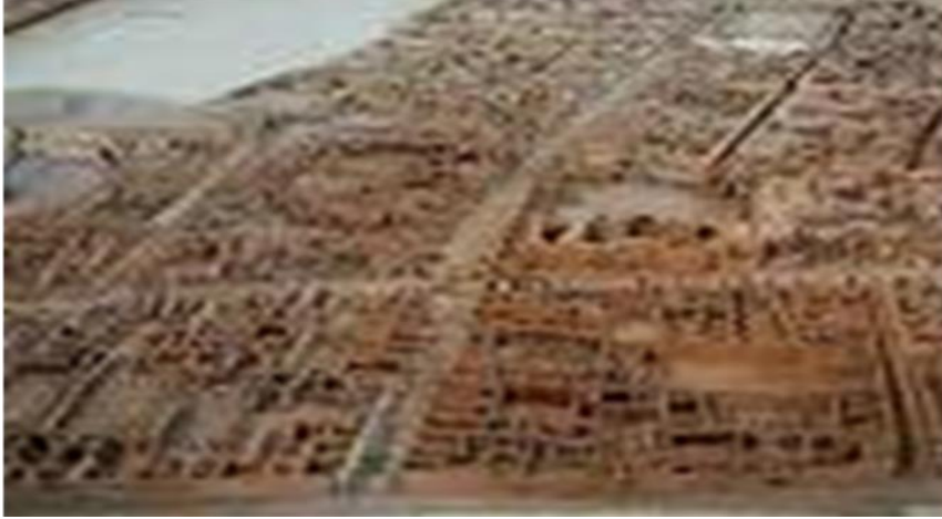
مدينة روما قديما.

أما المدن البيزنطية فتميزت بالصعوبة في قراءة رسمها ومدينة القسطنطينية تعتبر من أهم الشواهد المعبرة عن ذلك فقد تطورت في القرنين الرابع والخامس إلى أن أصبحت من الحواضر الكبرى آنذاك وتعددت مراكز هذه المدينة ومعالمها الأثرية حيث غلب على شكلها الخارجي الجانب البهرجي الذي يقوم على وضع مئات النصب التذكارية التي سرقت من بلدان الشرق الأوسط مهد الحضارات لتقوية وتعزيز الجانب الجمالي بهدف منافسة روما وحاول "قسطنطين" جعلها عاصمة مسيحية بحثة من خلال المنشآت المقترحة التي أسندت آنذاك ولنا مثال في الجزائر حيث تم بناء مدينة تبسة على هذا المنوال بين القرنين الخامس والسادس كمستعمرة متميزة بطابعها الريفي ومحيطها المقدس .