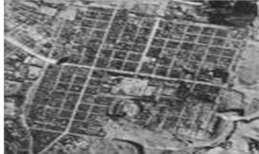
. المدينة الرومانية

مع مرور الزمن تطورت المدن الرومانية وظهرت فيها منشآت جديدة كالحمامات ، كما تطورت مدينة روما بشكل سريع وهذا التطور صاحبه نمو للسكان بلغ حدود المليون نسمة . ومن أهم المدن التي امتازت بالخطة الشطرنجية نجد مدن المعمرين ضواحي المدن الحديثة وكذا كل من توران وفلورانس بايطاليا.