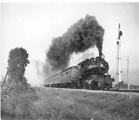
Train à vapeur

La véritable révolution mécanique est née de la découverte ou du perfectionnement d'un certain nombre d'engins agricoles, en particulier de l'application de nouvelles forces d'énergie (vapeur, moteur à explosion) à ces machines. C'est vers le milieu du XIXe siècle que ce processus a pris son essor en ramenant le « progrès » à trois types d'engins tractés par des machines à vapeur : la charrue, la moissonneuse et la batteuse.