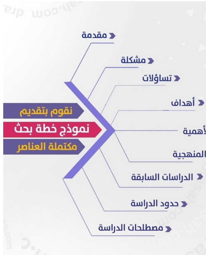
نموذج خطة بحث