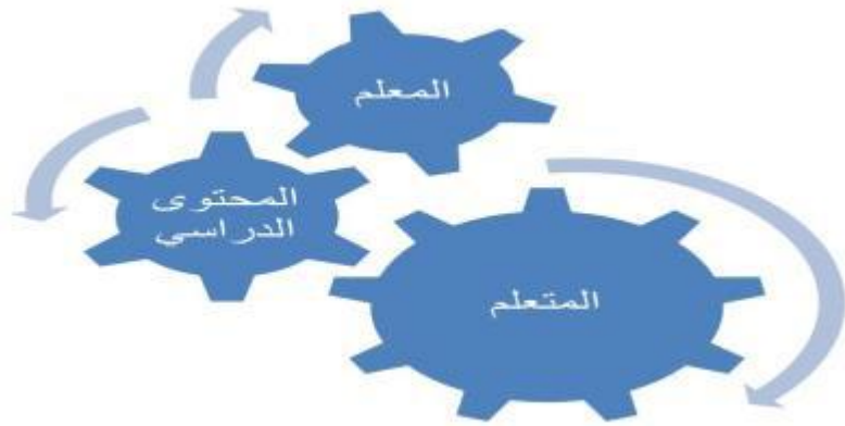
شكل رقم 01: المرتكزات التربوية

يعلمه المعلم من معارف وأفكار ومحتويات ومضامين وخبرات وتجارب يدخل ذلك ضمن علاقة ديداكتيكية. أما ما يحصله المتعلم من معارف ومعلومات يدخل ضمن علاقات التعلم. والجامع بين المرتكزات الثلاثة يسمى بالفضاء البيداغوجي. ومن هنا، يتضمن هذا الفضاء التربوي ثلاث علاقات أساسية هي: العلاقة الديداكتيكية ( المعلم التعليم ← المعرفة )، وعلاقة البيداغوجية (المعلم ← التكوين ← المتعلم )، وعلاقة التعلم ( المتعلم ← التعلم ← المعرفة )